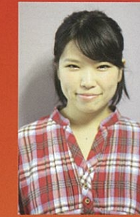
大園 愛 (神崎 理衣) 素直が一番！が幸せへの近道！ ~あたしの墮落人生~ http://s.ameblo.jp/y5966a